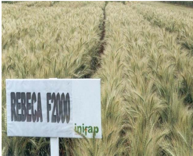
Figura 1. Espigas uniformes, de posición erecta y laxas de la variedad.

condiciones de sequía como en Sandoval, Ags. (menos de 180 mm), su altura baja hasta 40 cm, mientras que en lugares con alta precipitación como en Toluca, Méx. (más de 750 mm), llega a medir 105 cm. Su ciclo es tardío, desde 95 días hasta 148 días a madurez fisiológica en los ambientes de sequía y lluviosos antes indicados, respectivamente.