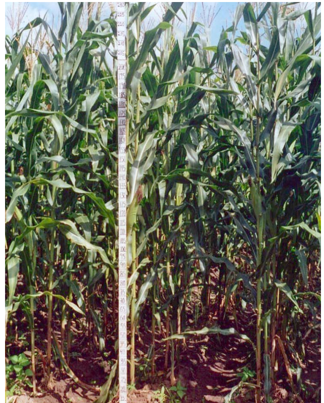
Figura 1. Planta del H-553C de porte intermedio y posición de mazorca baja, que favorece su resistencia al acame.

el contenido de triptofano y lisina en el híbrido H-553C superó en 44 y 46 % respectivamente, al híbrido normal H-515. En cuanto al índice de calidad (IC), que es la relación entre el contenido de triptofano y el contenido de proteína expresado en porcentaje de la proteína total, el H-553C tiene un IC de 0.91 %, que superó en 34 centésimas de punto porcentual al H-515 que tuvo un IC de 0.57 %. El IC se calcula al dividir el porcentaje de triptofano entre el porcentaje de proteína y el cociente se multiplica por 100 (Ortega et al. , 2001).