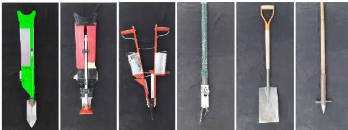
Figura 1. Herramientas manuales utilizadas en la evaluación agrotécnica: Yufeng, Boshima, Fitarelli, GreenSeeder, Pala y Espeque (izquierda a derecha).

La herramienta marca Yufeng de origen chino, fabricada en material de plástico en su mayoría cuenta únicamente con un depósito para semillas. El dosificador es de rodillo con una serie de orificios en su periferia. La punta está formada por un compartimento de precarga y una pala de 25 cm de largo encargada de hacer el orificio en el suelo. Su dosificador se acciona con el movimiento de empuje vertical hacia el suelo.